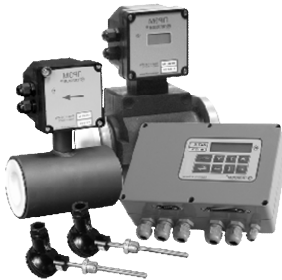
Рисунок 1 – Внешний вид теплосчетчика

Внешний вид теплосчетчика приведен на рисунке 1.