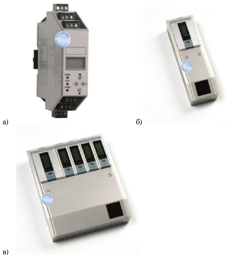
Рисунок 2 – а) Unipoint, б) Touchpoint 1, в) Touchpoint 4