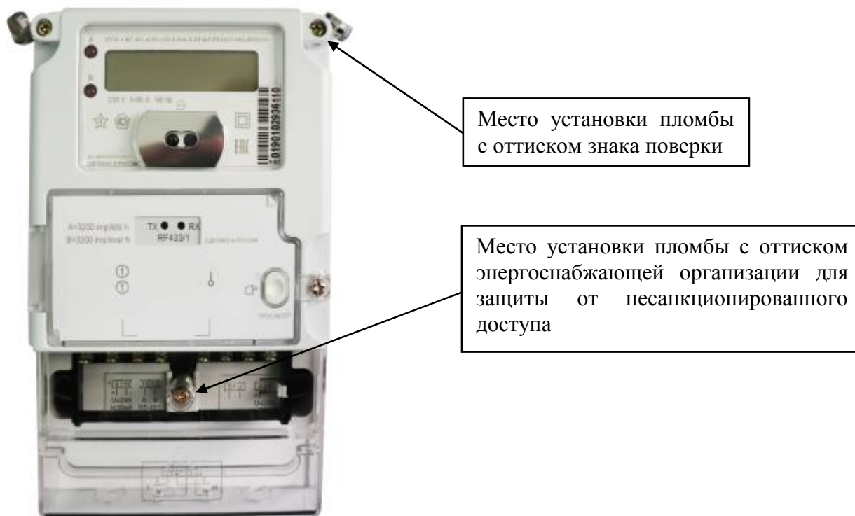
Рисунок 3 – Общий вид счётчика в корпусе типа W3