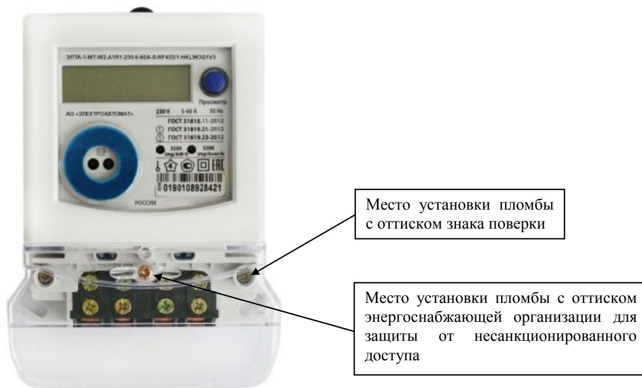
Рисунок 2 – Общий вид счётчика в корпусе типа W2