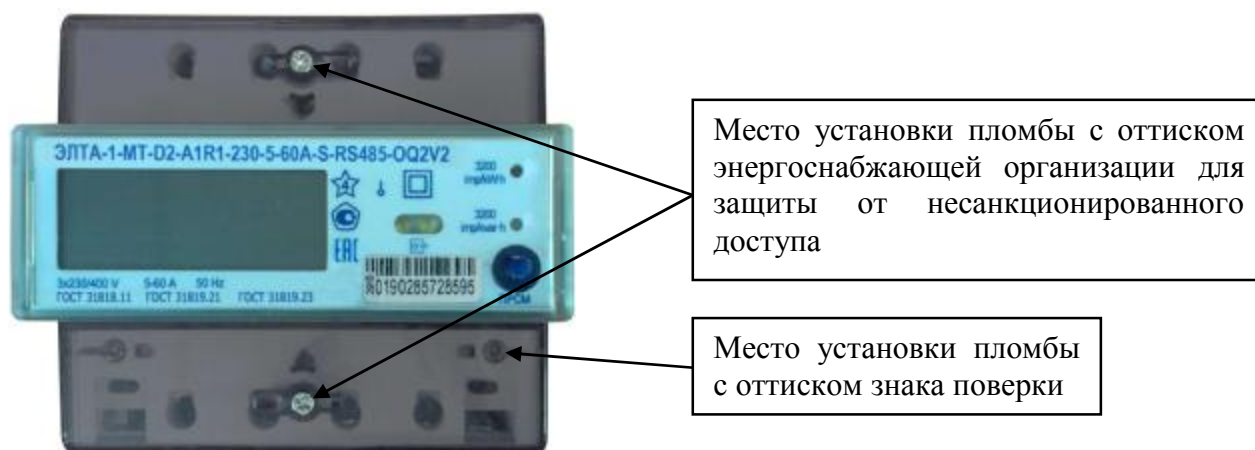
Рисунок 5 – Общий вид счётчика в корпусе типа D2