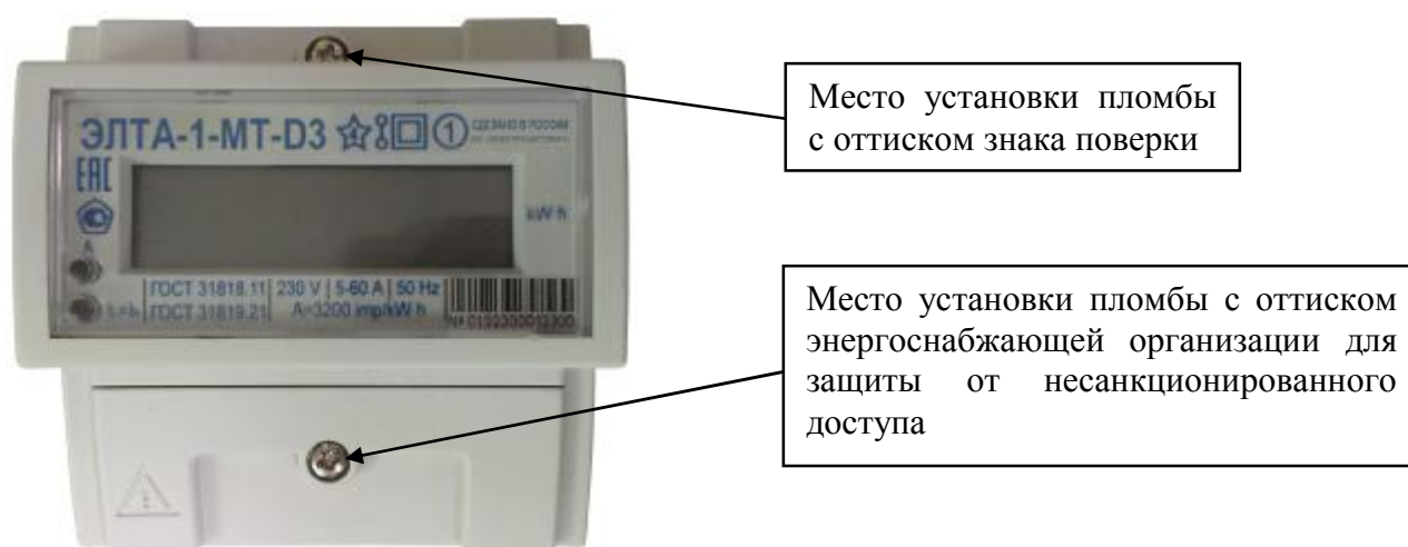
Рисунок 6 – Общий вид счётчика в корпусе типа D3