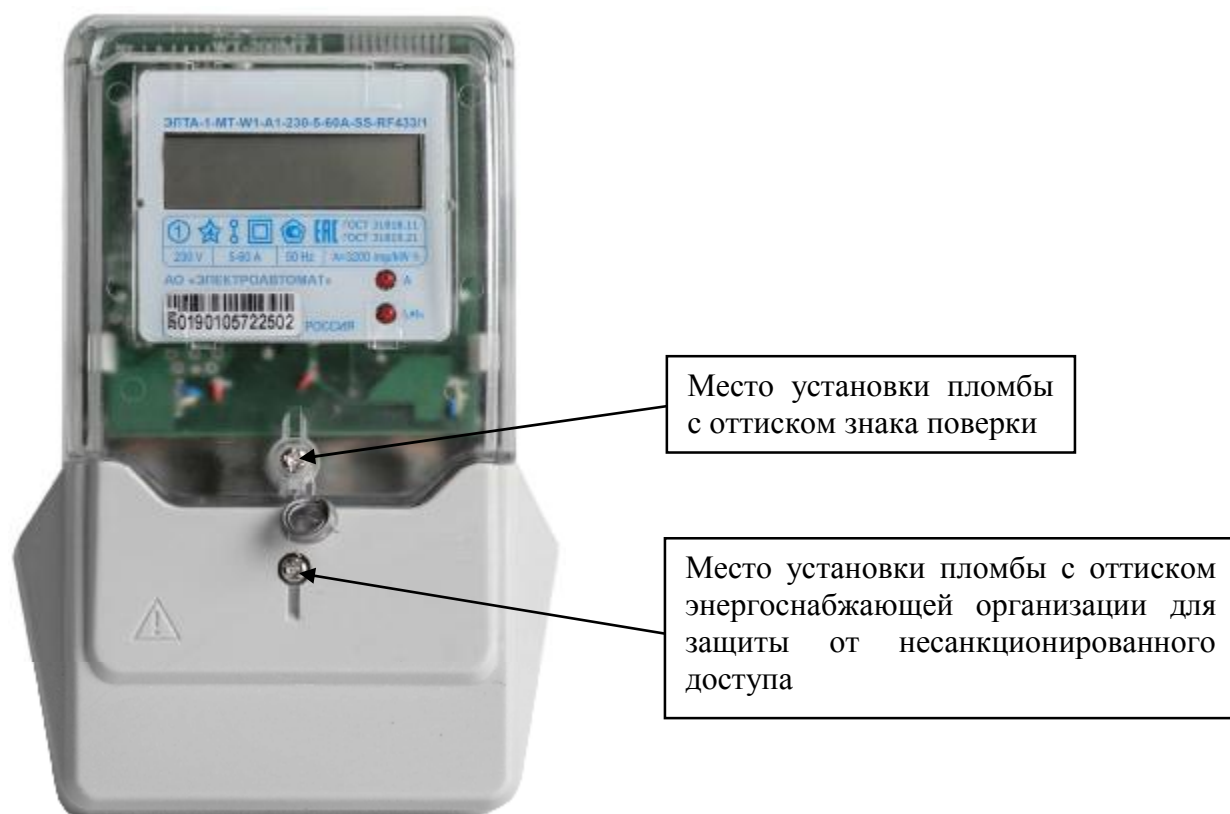
Рисунок 1 – Общий вид счётчика в корпусе типа W1