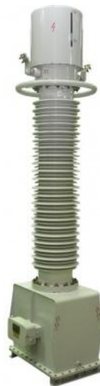
Рисунок 2 – Общий вид трансформаторов тока ТБМО-220