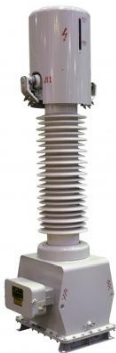
Рисунок 2 – Общий вид трансформаторов тока ТБМО-110

Рабочее положение трансформаторов в пространстве – вертикальное.