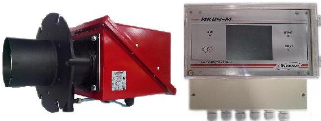
Рисунок 4 – Общий вид измерителя ИКВЧ-М-Н