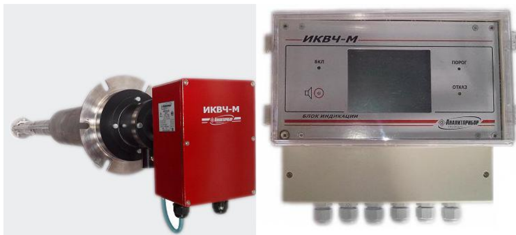
Рисунок 2 – Общий вид измерителя ИКВЧ-М-ДЗ