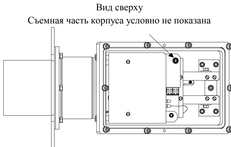
Стрелкой указано место пломбировки от несанкционированного доступа Рисунок 5 – Схема пломбировки МОК измерителя ИКВЧ-М-Н от несанкционированного доступа