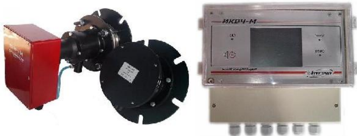
Рисунок 1 – Общий вид измерителя ИКВЧ-М-Д

МОК, рефлектор (для ИКВЧ-М-Д) или зонд (для ИКВЧ-М-ДЗ) при помощи комплекта монтажных частей монтируются на газоходе или дымовой трубе. БИ располагается в операторской и связывается с МОК четырехпроводным кабелем электропитания и связи.