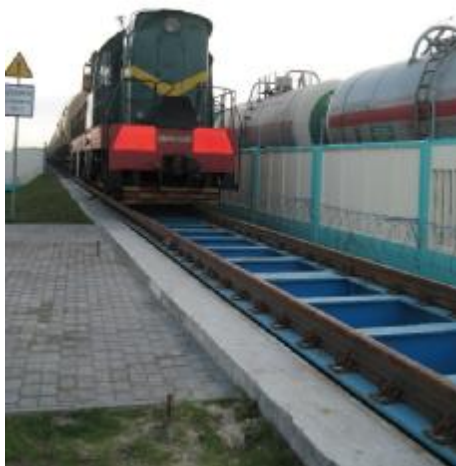
Рисунок 1 – Общий вид ГПУ весов

Сигнальные кабели датчиков подключаются к соединительным коробкам, которые подключаются к индикатору.