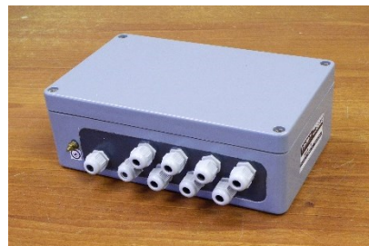
Рисунок 2 – Внешний вид ПД в зависимости от модификации (количества ГПП) весов.