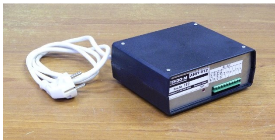
Рисунок 3 – Внешний вид АИП.

Маркировка весов выполнена в виде таблички, закрепленной на ГПУ, и содержит следующие данные: