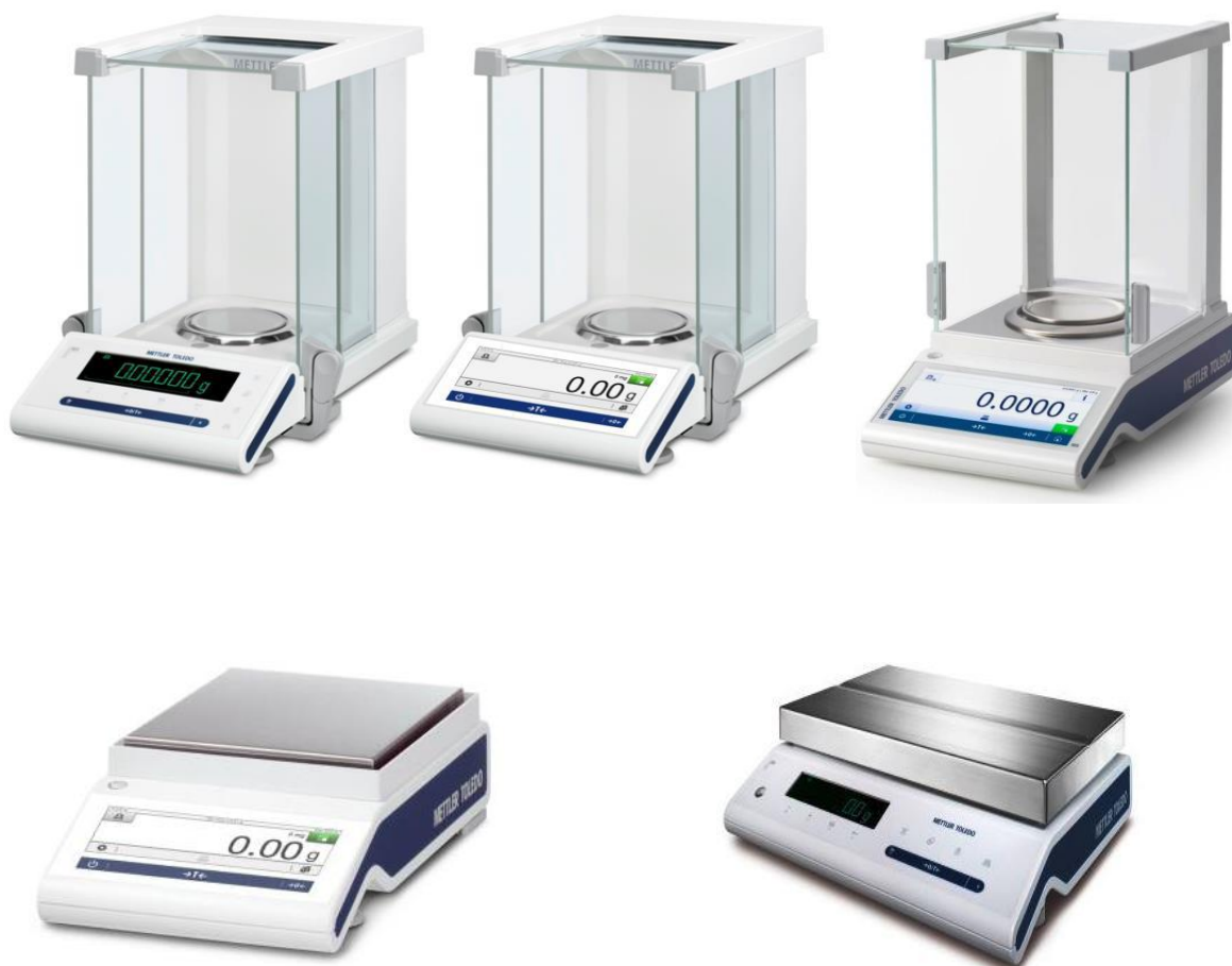
Рисунок 1 – Общий вид весов неавтоматического действия MS

Весы выпускаются в трех основных модификациях MS, ML, ME, внешний вид которых показан на рисунках 1, 2 и 3.