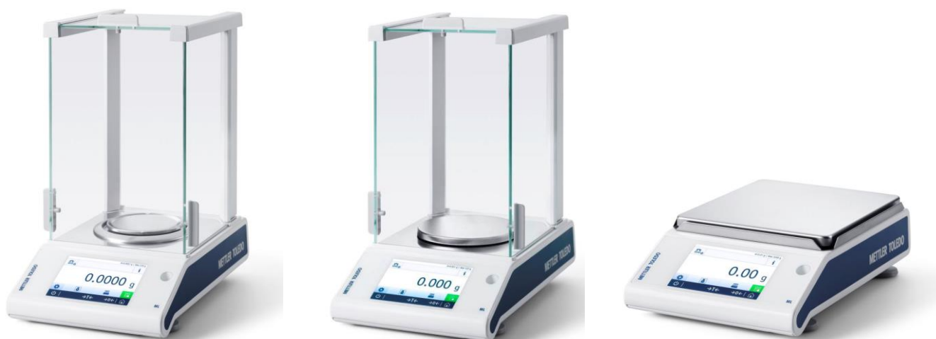
Рисунок 2 – Общий вид весов неавтоматического действия ML