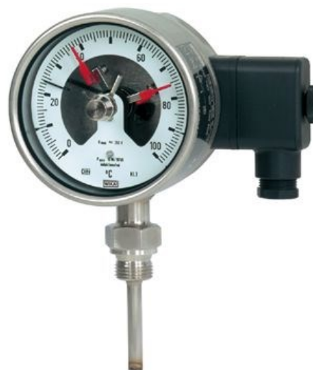
Рисунок 4 – Общий вид термометров серии 73 модификаций R73.100, R73.160 с электроконтактами, серии TG73 с радиальным присоединением термобаллона и электроконтактами, серии TGS73 с радиальным присоединением термобаллона