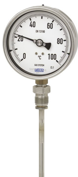
Рисунок 3 – Общий вид термометров серии 73 модификаций R73.100, R73.160 и серии TG73 с радиальным присоединением термобаллона