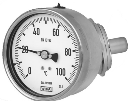
Рисунок 9 – Общий вид термометров серии 74 модификации A74.100 и серии TG74 с осевым присоединением термобаллона