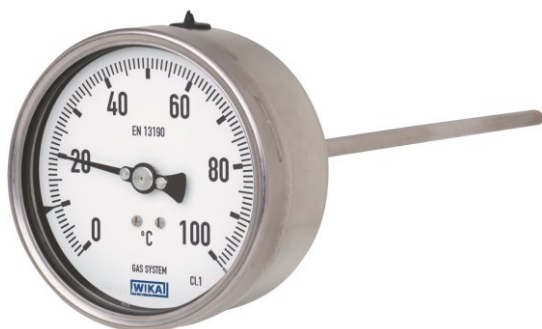
Рисунок 1 – Общий вид термометров серии 73 модификаций A73.100, A73.160 и серии TG73 с осевым присоединением термобаллона