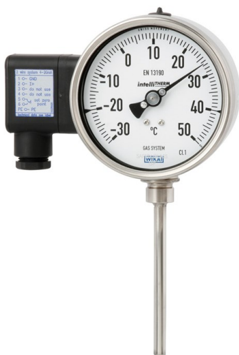
Рисунок 13 – Общий вид термометров серии 75 модификации A75.100