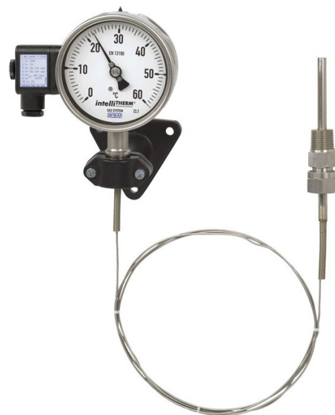
Рисунок 15 – Общий вид термометров серии TGT73 модификаций TGT73.100, TGT73.160

Место нанесения знака поверки термометров представлено на рисунке 16.