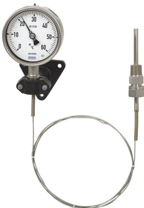
Рисунок 7 – Общий вид термометров серии 73 модификаций F73.100, F73.160 и серии TG73 с гибким капиллярным присоединением термобаллона