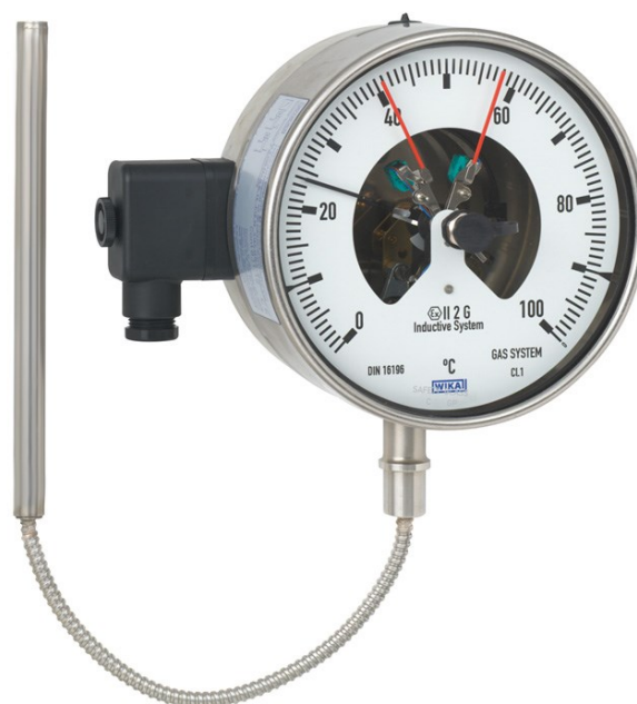
Рисунок 8 – Общий вид термометров серии 73 модификаций F73.100, F73.160 с электроконтактами, серии TG73 с гибким капиллярным присоединением термобаллона и электроконтактами, серии TGS73 с гибким капиллярным присоединением термобаллона