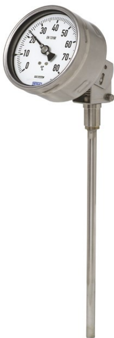
Рисунок 5 – Общий вид термометров серии 73 модификаций S73.100, S73.160 и серии TG73 с наклонно-поворотным присоединением термобаллона