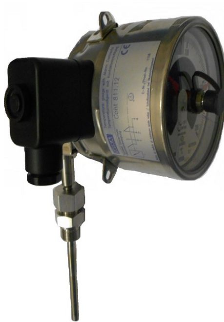
Рисунок 6 – Общий вид термометров серии 73 модификаций S73.100, S73.160 с электроконтактами, серии TG73 с наклонно-поворотным присоединением термобаллона и электроконтактами, серии TGS73 с радиальным присоединением термобаллона