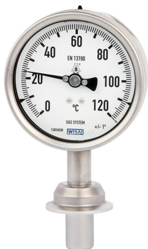
Рисунок 11 – Общий вид термометров серии 74 модификации R74.100 и серии TG74 с радиальным присоединением термобаллона