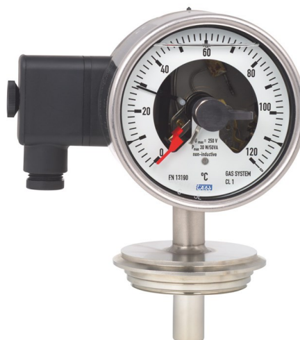
Рисунок 12 – Общий вид термометров серии 74 модификации R74.100 с электроконтактами, серии TG74 с радиальным присоединением термобаллона и электроконтактами, серии TGS74 с радиальным присоединением термобаллона