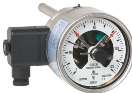
Рисунок 10 – Общий вид термометров серии 74 модификации A74.100 с электроконтактами, серии TG74 с осевым присоединением термобаллона и электроконтактами и серии TGS74 с осевым присоединением термобаллона