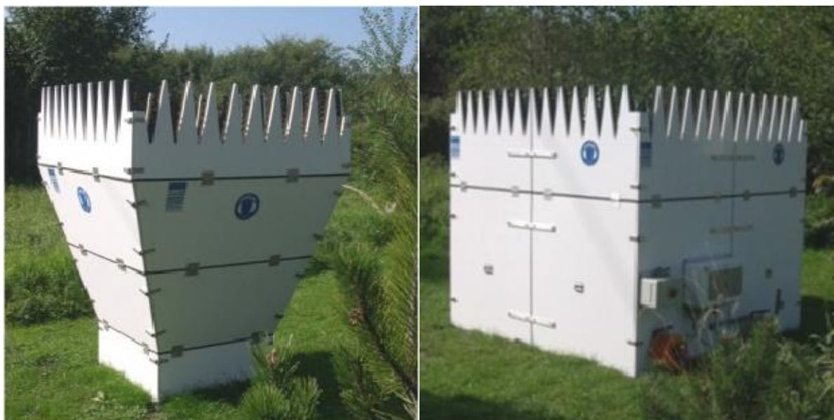
Рисунок 1 – Внешний вид антенного модуля содаров модификации PCS.2000-24 (слева), модификации PCS.2000-64 (справа)