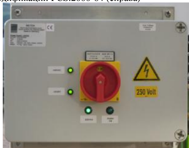
Рисунок 2 – Внешний вид интерфейсного модуля и ПК, смонтированных в едином корпусе (слева). Модуль питания (справа)