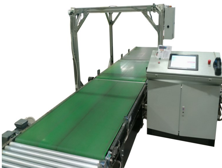
средство измерений с пультом управления