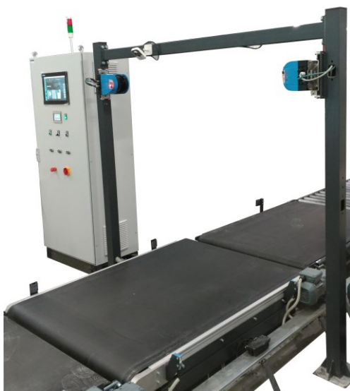
средство измерений с модулем измерений габаритных размеров и шкафом управления

Внешний вид УОАД и схема пломбировки от несанкционированного доступа представлена на рисунке 2.