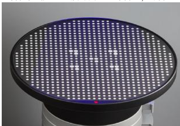
Рисунок 3 – Общий вид калибровочной пластины приборов оптических координатно-измерительных бесконтактных Solutionix D500™, D700™