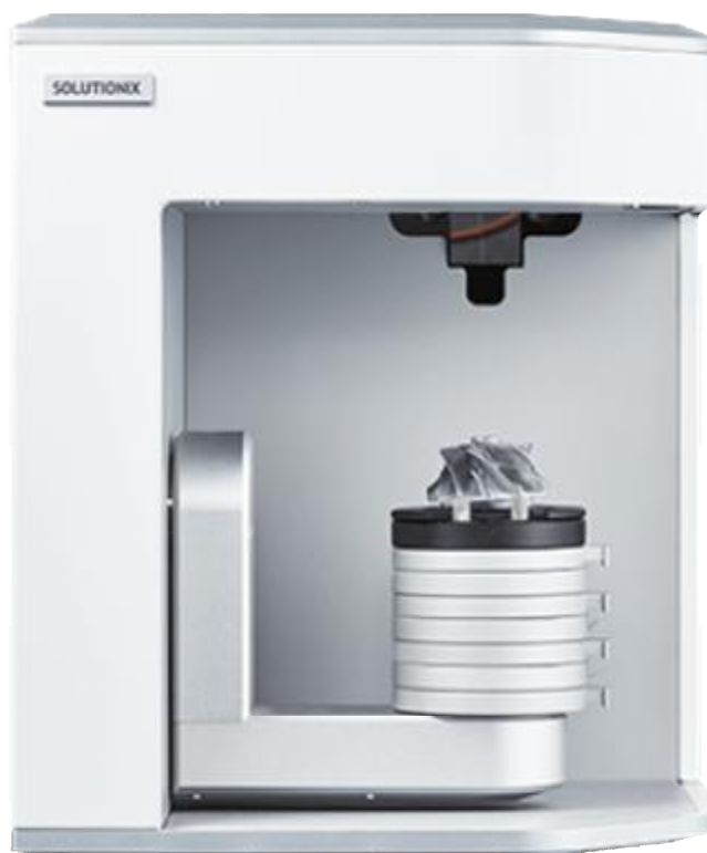
Рисунок 2 – Общий вид приборов оптических координатно-измерительных бесконтактных Solutionix D500™, D700™