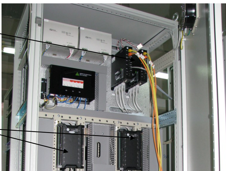
Рисунок 3 – Компоненты ИВК.

Модули измерительные аналоговые ввода/вывода