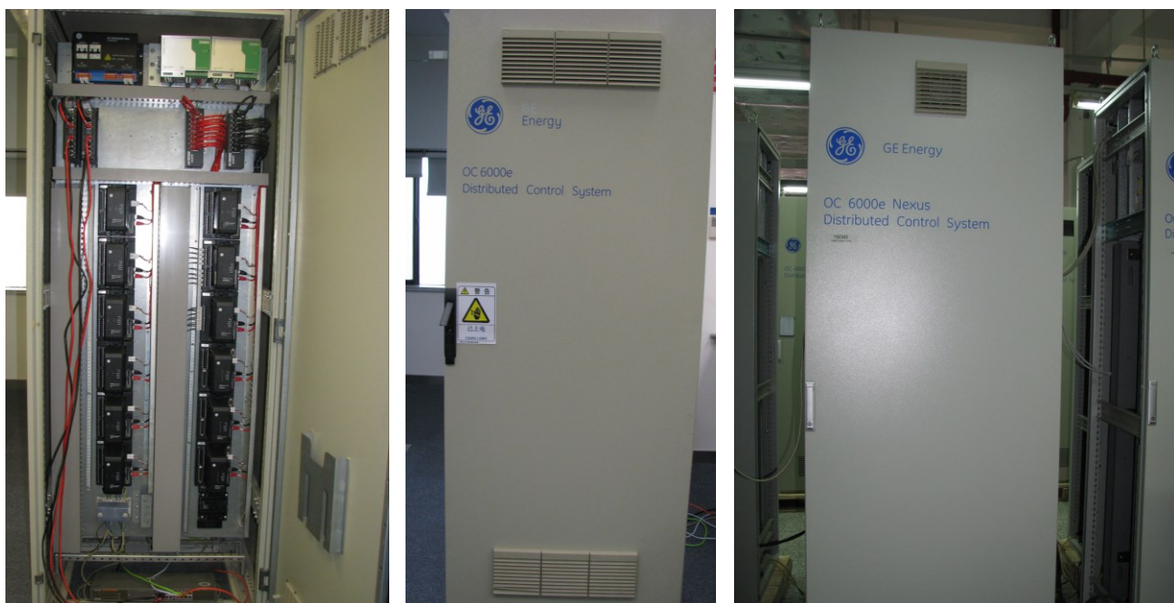
Рисунок 2 – Внешний вид приборного шкафа ИВК ОС 6000е, ОС 6000е Nexus.