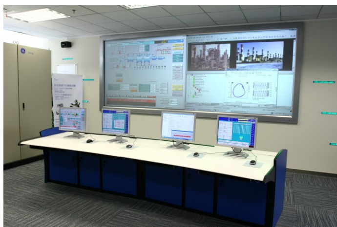
Рисунок 4 – Автоматизированное рабочее место оператора.