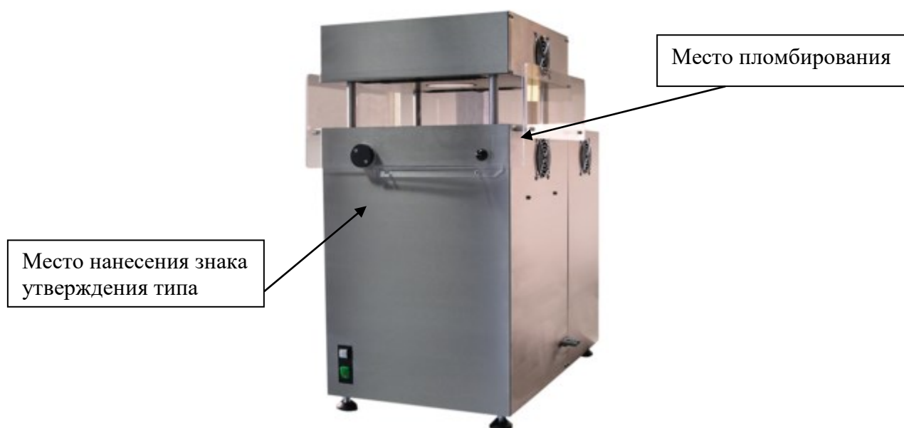
Рисунок 4 - Внешний вид приборов модели ECO-VICAT 300/*

Принцип работы прибора VICAT/HDT основан на измерении значения медленно возрастающей температуры в термостате с исследуемым образцом пластика, при котором под воздействием механической нагрузки: