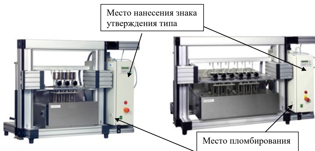
Рисунок 3 - Внешний вид приборов моделей VICAT/HDT Tester IC*, VICAT/HDT Tester IC*+ (слева – на три станции, справа – на шесть станций)