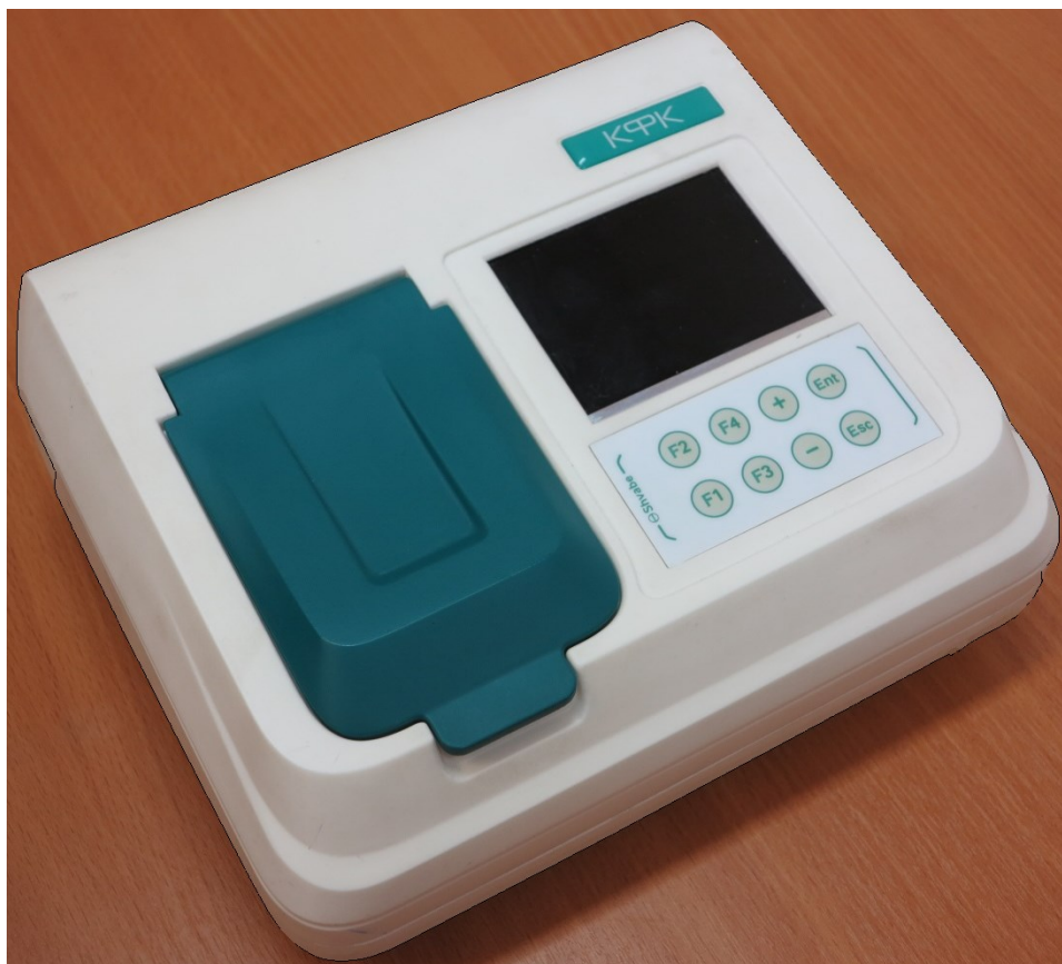
Рисунок 1 - Фотография общего вида фотометра КФК