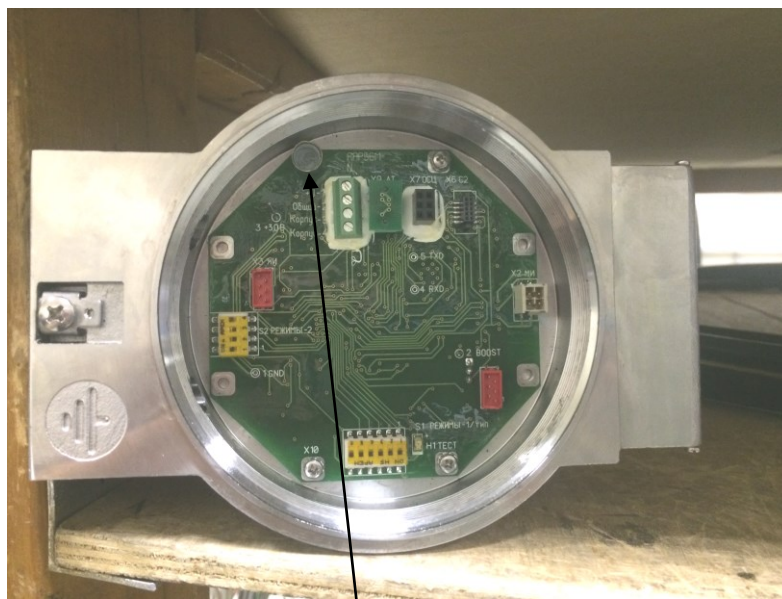
Рисунок 2 - Схема пломбировки от несанкционированного доступа