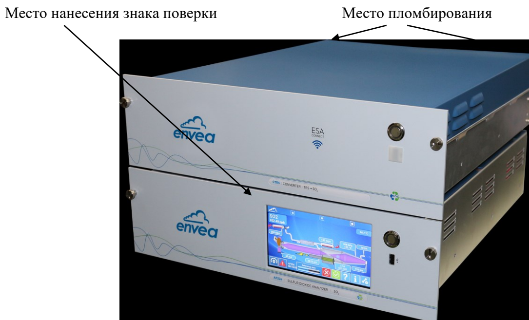
Рисунок 2 – Общий вид газоанализаторов AF22e модификации AF22e/CTRS