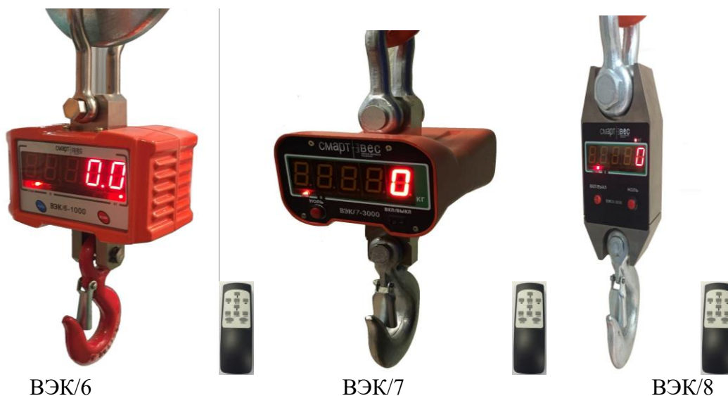
Рисунок 1 – Общий вид весов в зависимости от варианта исполнения

В весах предусмотрена защита от несанкционированного изменения установленных регулировок (установленных параметров и регулировки чувствительности (юстировки)). Вход в подпрограмму юстировки защищен административным паролем.