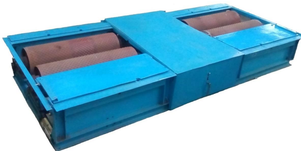
Рисунок 3 – Общий вид стенов СИТ-У-М