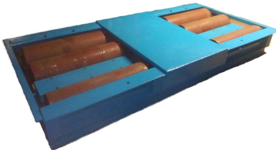
Рисунок 2 – Общий вид стендов СИТ-У