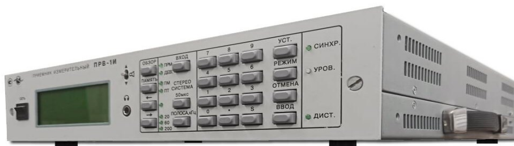
Рисунок 2 – Вид сбоку приемника в переносном исполнении