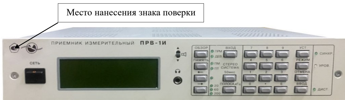
Рисунок 1 – Общий вид приемника в переносном исполнении