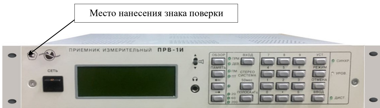
Рисунок 3 – Общий вид приемника в стойечном исполнении (крепления к стойке)