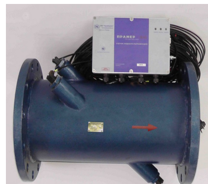
Рисунок 3 – Внешний вид счетчиков исполнения 03