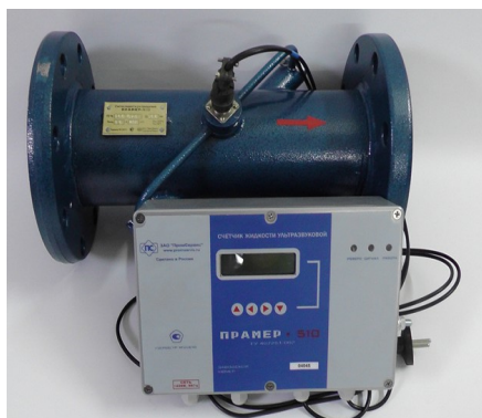
Рисунок 1 – Внешний вид счетчиков исполнения 01

Внешний вид счетчиков жидкости ультразвуковых ПРАМЕР-510 исполнений 01, 02 и 03 приведен на рисунках 1, 2 и 3.