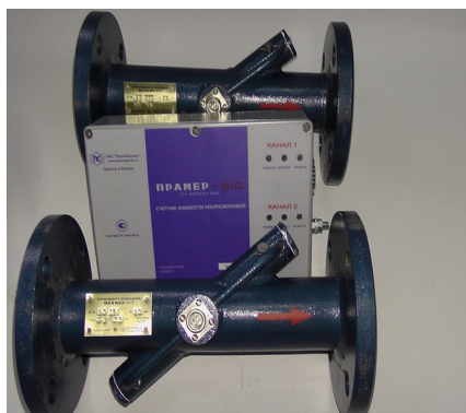
Рисунок 2 – Внешний вид счетчиков исполнения 02