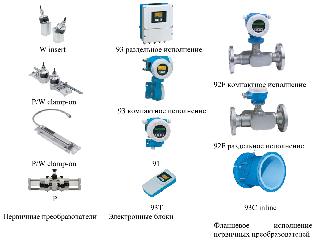
Рисунок 1 – Внешний вид расходомеров семейства Prosonic Flow

Схема пломбирования приведена на рисунке 2.