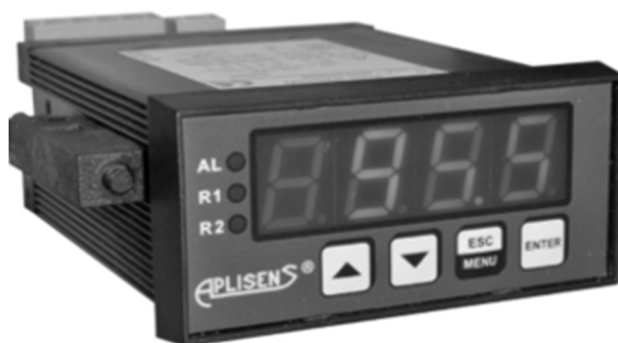
Измерители исполнения PMS-620TE