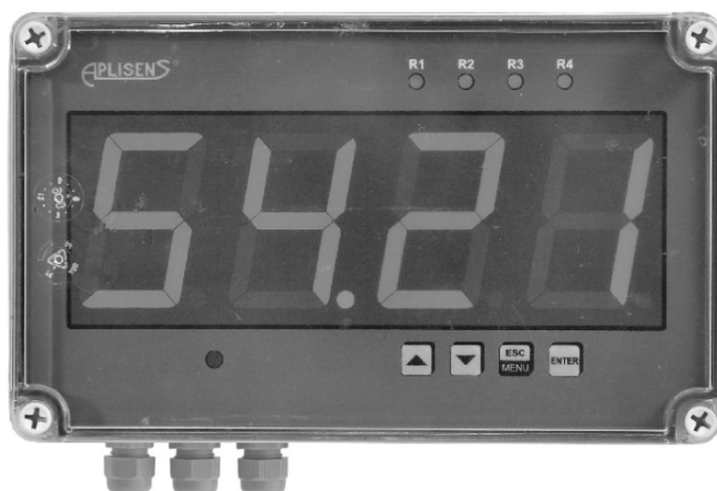
Измерители исполнения PMS-620N