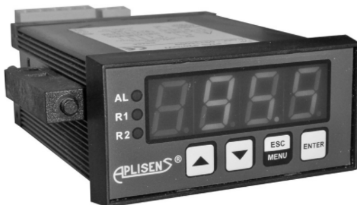
Измерители модификации PMS-920