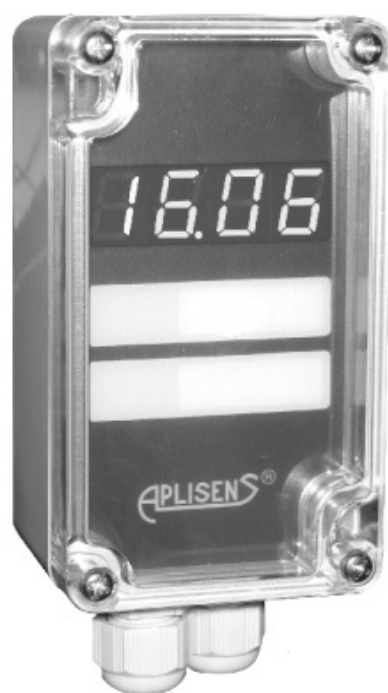
Измерители исполнения PMS-11N