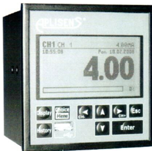
Измерители исполнения PMS-100-R

Рисунок 1 - Общий вид измерителей с указанием места нанесения знака утверждения типа, места нанесения заводского номера на примере измерителей исполнения PMS-620TE