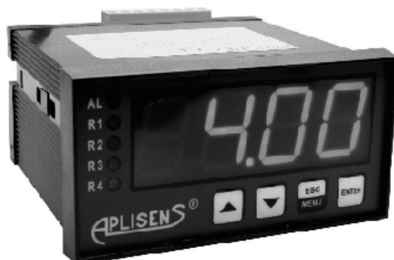
Измерители исполнения PMS-970P