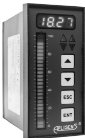
Измерители исполнения PMS-970T