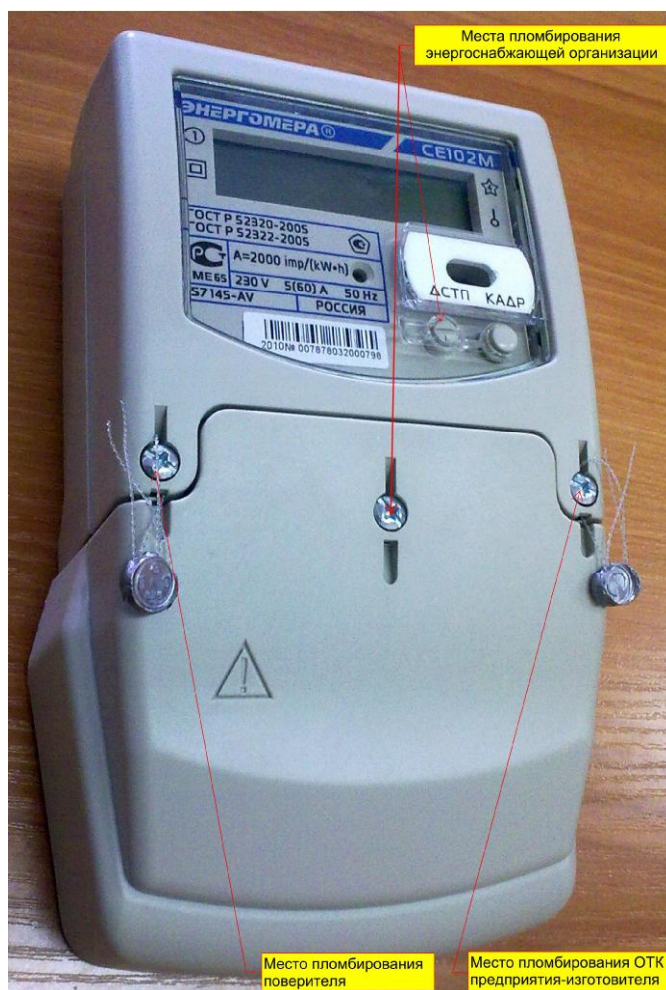
Рисунок 3 - Общий вид счетчика CE102M S7