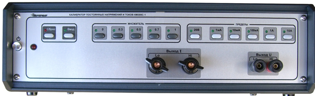
Рисунок 1 – Общий вид калибратора

Фотография общего вида средства измерений с указанием места нанесения знака утверждения типа, знака поверки в виде наклейки и оттиска поверительного клейма нанесенного на мастичную пломбу, заводского номера, приведена на рисунке 2.