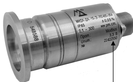
Место нанесения заводского номера