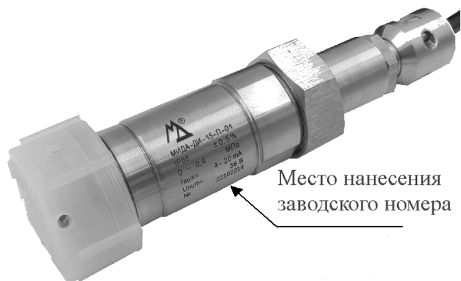
Место нанесения заводского номера