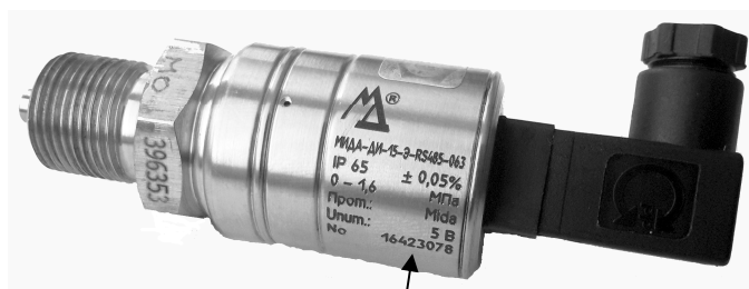
Место нанесения заводского номера

Заводской номер наносится методом лазерной гравировки на корпус датчика. Общий вид датчиков и место нанесения заводского номера представлены на рисунках 1-6.