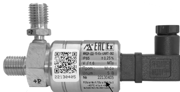
Место нанесения заводского номера