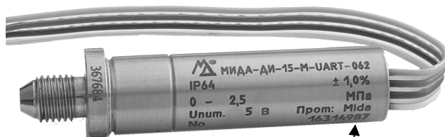
Место нанесения заводского номера