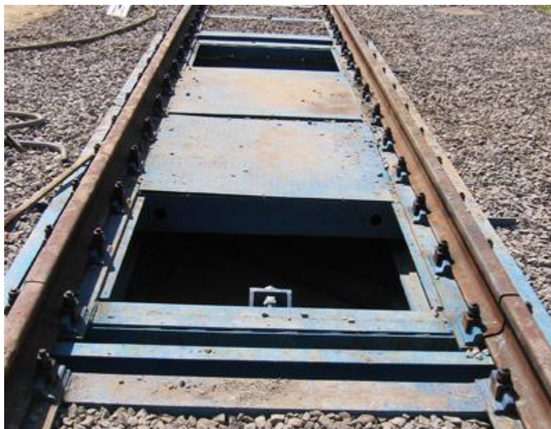
Рисунок 1 - Общий вид ГПУ весов