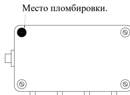
Рисунок 3 - Схема пломбировки соединительной коробки от несанкционированного доступа

Для защиты от несанкционированного доступа, настройки и вмешательства используется пломбировка корпуса (рисунки 3 - 5).