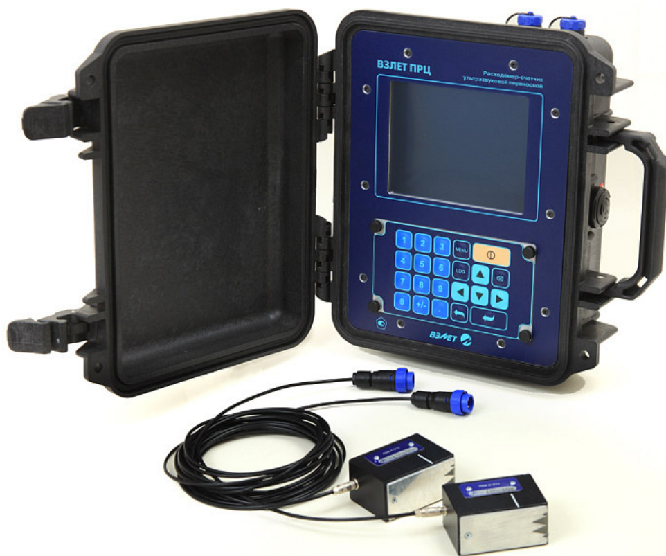
Рисунок 1 - Общий вид расходомеров-счетчиков ультразвуковых переносных «ВЗЛЕТ ПРЦ»

Общий вид расходомеров приведен на рисунке 1.