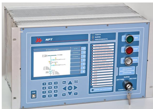
Вид со стороны передней панели