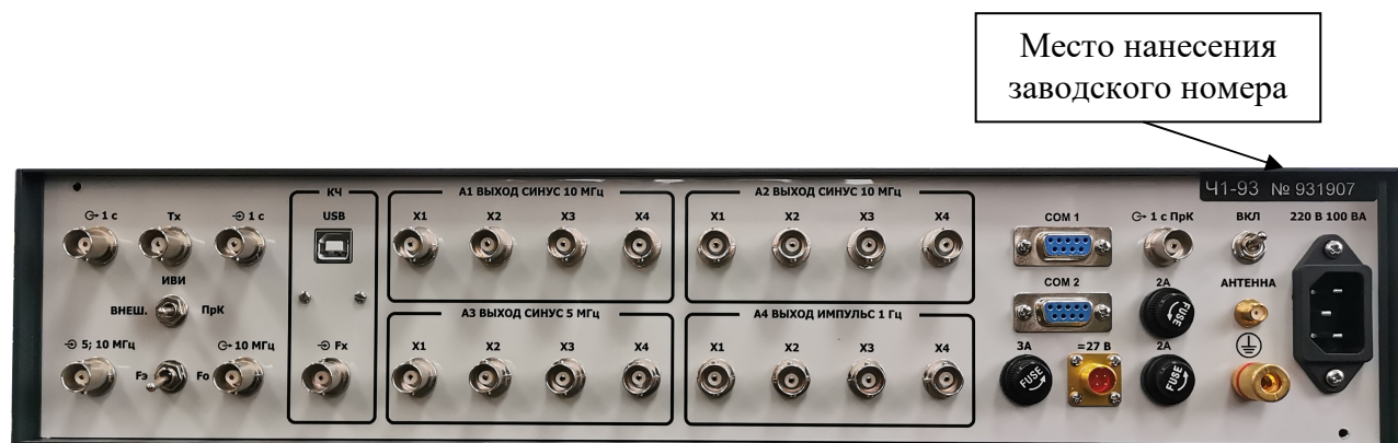
Рисунок 2 - Обозначение места нанесения заводского номера