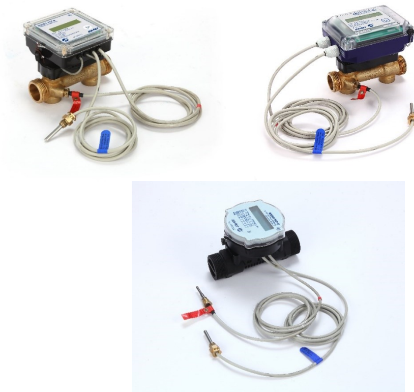
Рисунок 1 - Общий вид теплосчетчиков-регистраторов «ВЗЛЕТ ТСП-К» исполнения ТСП-К-0XX

Общий вид теплосчетчиков-регистраторов «ВЗЛЕТ ТСП-К» (исполнений ТСП-К-1XX, ТСП-К-2XX, ТСП-К-3XX) показан на рисунке 2.