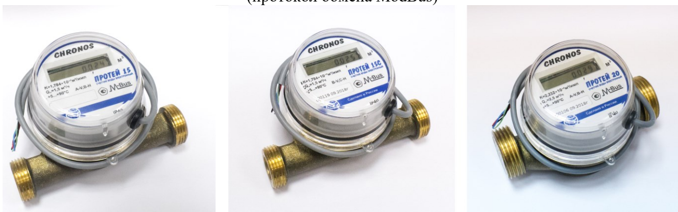
Рисунок 3 – Общий вид счетчиков с беспроводным интерфейсом M-Bus (протокол обмена M-Bus)