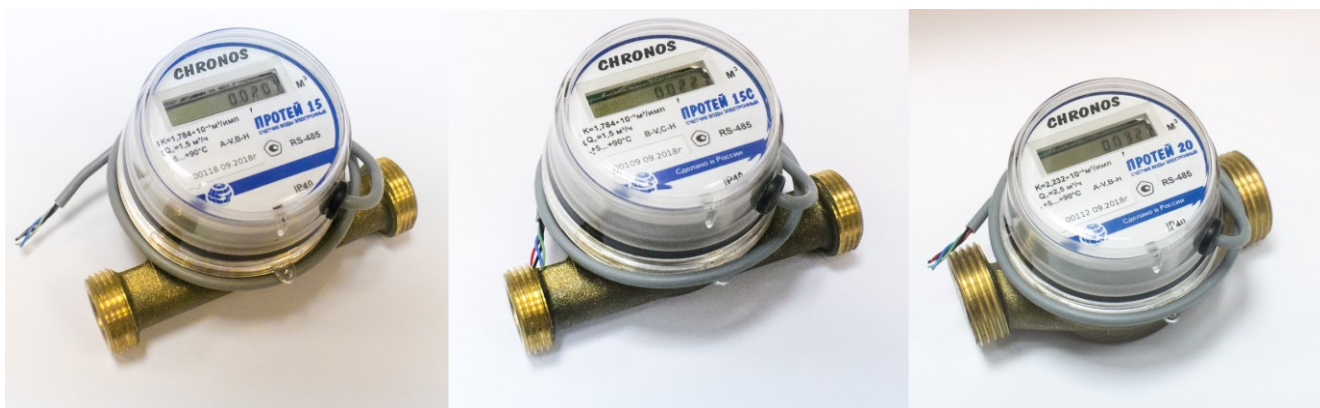
Рисунок 2 – Общий вид счетчиков с беспроводным интерфейсом RS-485 (протокол обмена ModBus)