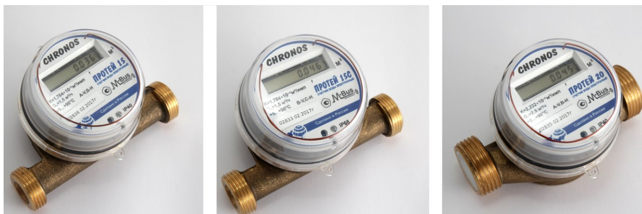
Рисунок 1 – Общий вид счетчиков с беспроводным интерфейсом 433 МГц (протокол обмена wM-Bus)