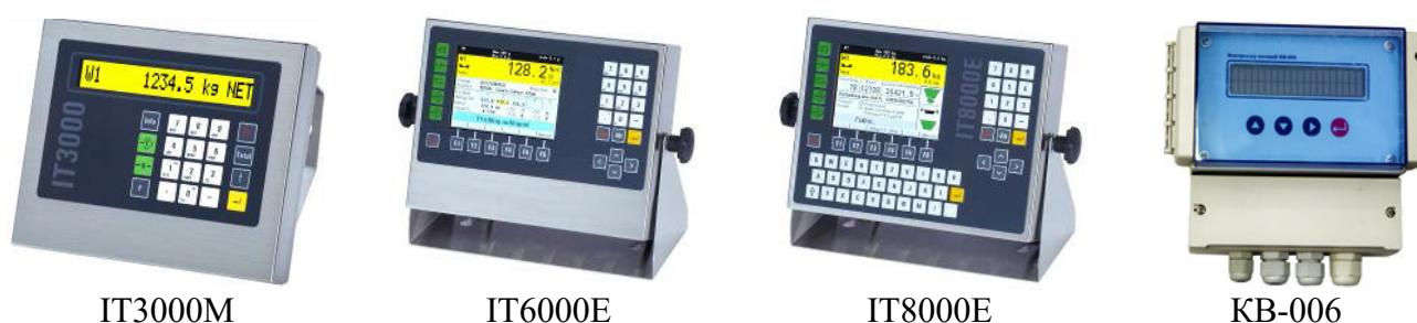
Рисунок 2 – Общий вид приборов весов