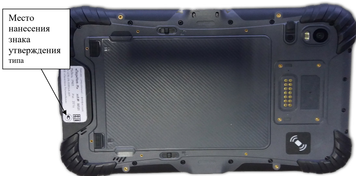
Рисунок 2 – Место нанесения знака утверждения типа комплексов исполнения 1