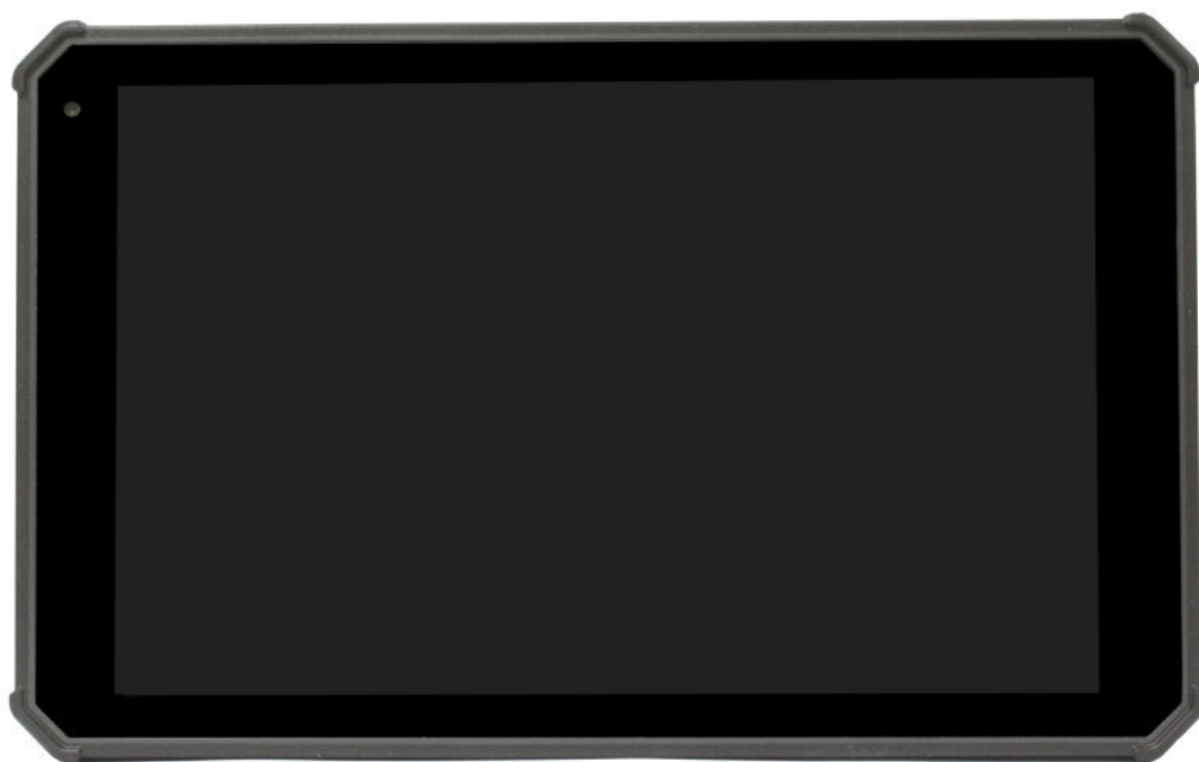
Рисунок 3 – Общий вид комплексов исполнения 2