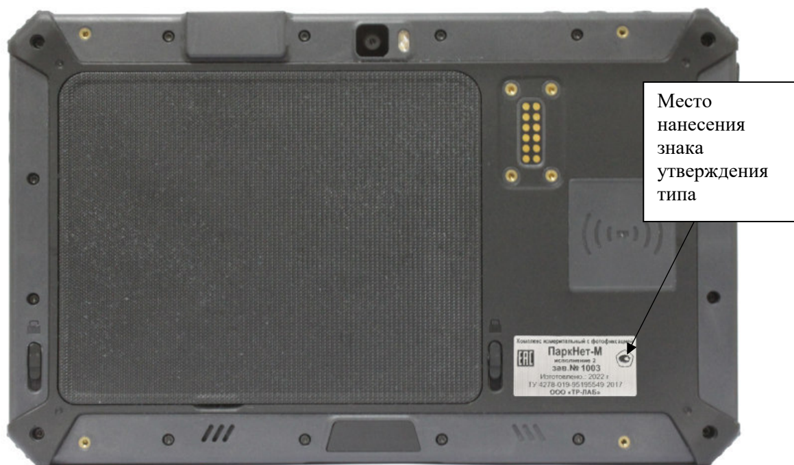
Рисунок 4 – Место нанесения знака утверждения типа комплексов исполнения 2

Пломбирование комплексов не предусмотрено.