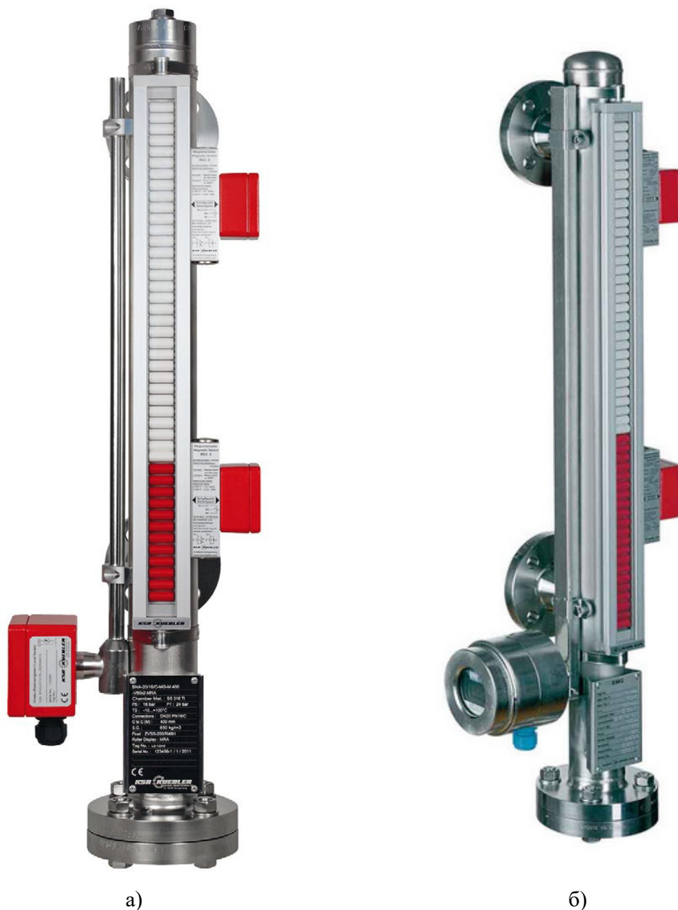
Рисунок 1 – Общий вид уровнемеров поплавковых байпасных УПБ 1015 а) без показывающего устройства; б) с показывающим устройством

Общий вид уровнемеров представлен на рисунке 1.