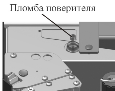
Индексы: СЗ; СЗМ (вид при поднятой платформе ГПУ)