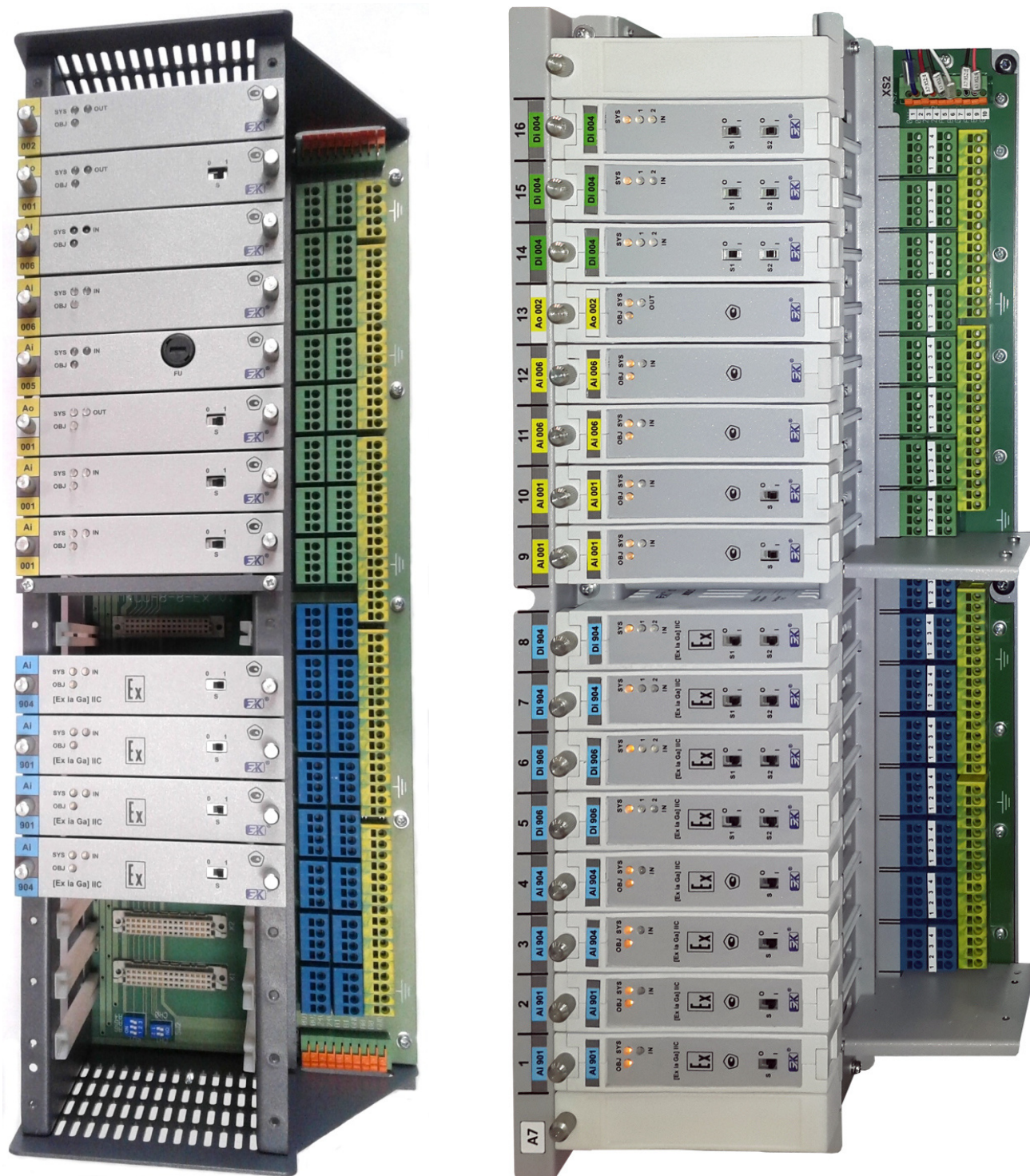
Рисунок 3 - Общий вид модулей в составе блока БВВ

Пломбирование модулей не предусмотрено. Нанесение знака поверки на модули не предусмотрено. Заводской номер, идентифицирующий каждый экземпляр средства измерений, наносится нестираемым маркером на стенку корпуса, как показано на рисунках 1 и 2. Номер имеет цифровое обозначение, состоящее из сочетания арабских цифр.