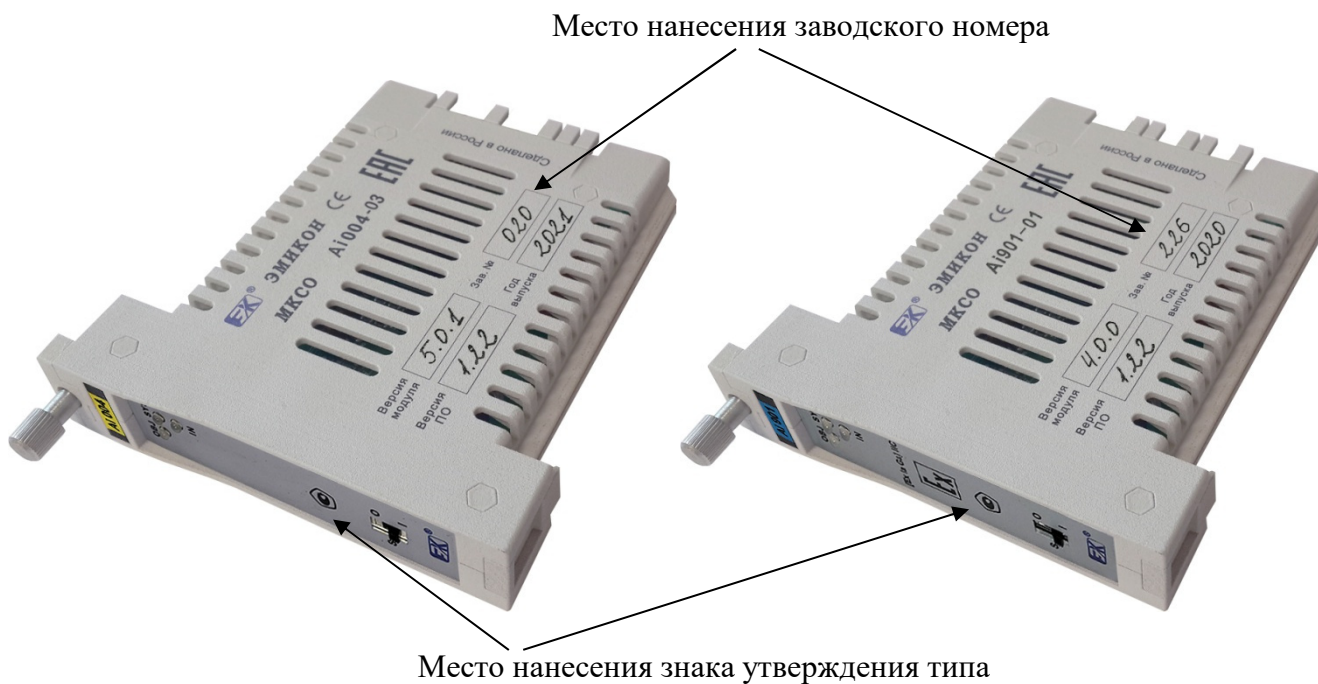
Рисунок 2 - Общий вид модулей с пластиковым корпусом