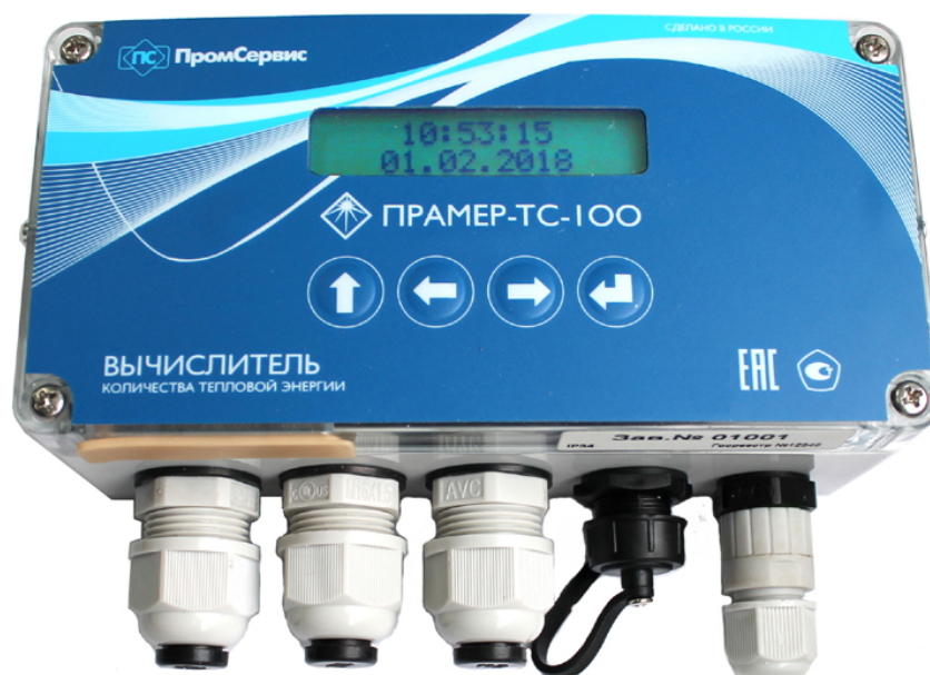
Рисунок 1 – Внешний вид вычислителей

Для фиксации по месту монтажа вычислителя на тыльной стороне основания устанавливаются DIN-клипсы под монтажную рейку или монтажные кронштейны. Внутри крышки расположен микропроцессорный модуль, выполняющий измерение, вычисление, отображение и хранение значений параметров теплоносителя, а также передачу информации на внешние устройства. Управление и навигация по меню вычислителя осуществляется на индикаторе вычислителя с помощью четырёхкнопочной клавиатуры. Внешний вид вычислителей представлен на рисунке 1.