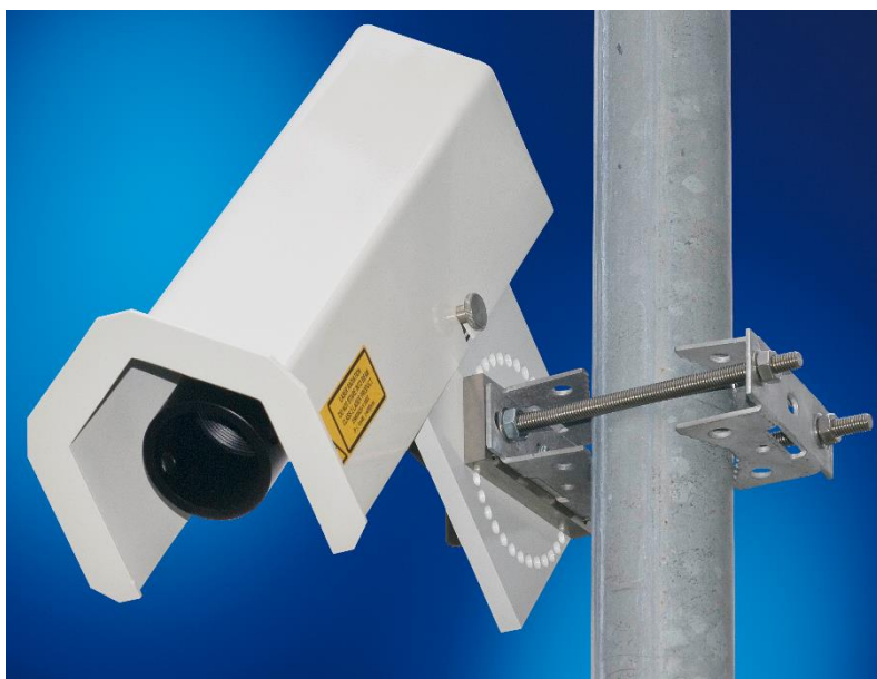
Рисунок 1 — Общий вид датчика высоты снежного покрова SHM30/31