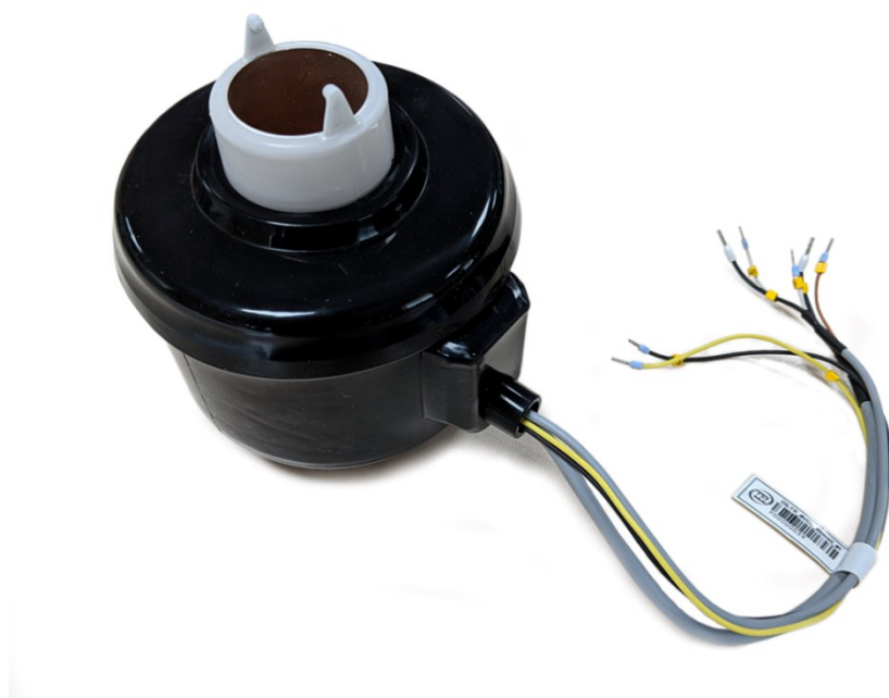
Рисунок 1 - Общий вид КДТН