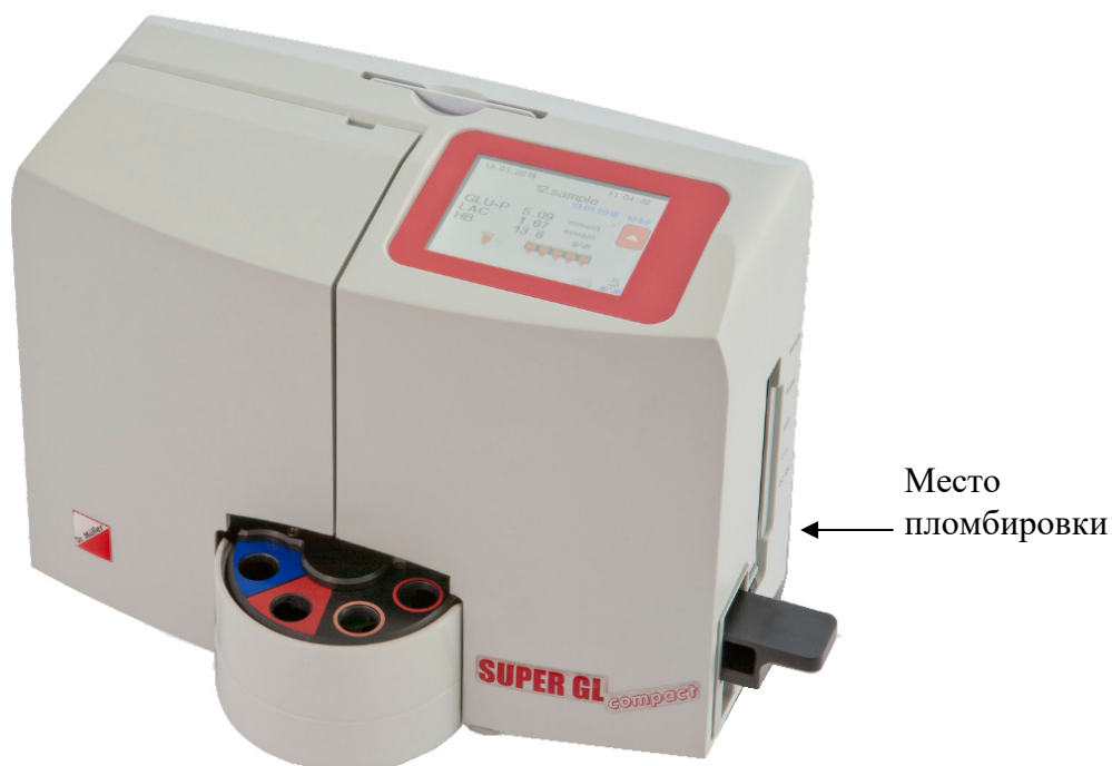
Рисунок 2 - Общий вид анализатора варианта исполнения SUPER GL compact