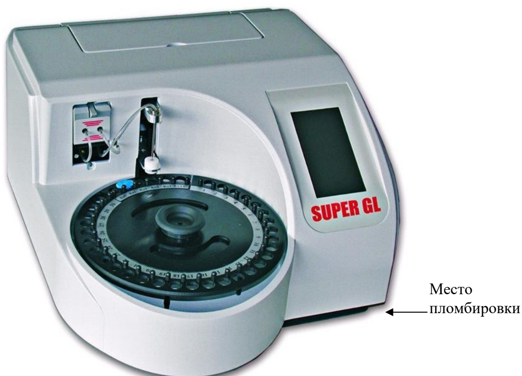
Рисунок 1 - Общий вид анализатора варианта исполнения SUPER GL

Общий вид анализатора варианта исполнения SUPER GL представлен на рисунке 1; варианта исполнения SUPER GL compact - на рисунке 2; схема пломбировки анализаторов от несанкционированного доступа представлена на рисунках 1 и 2; схема нанесения маркировки – на рисунке 3 и 4.