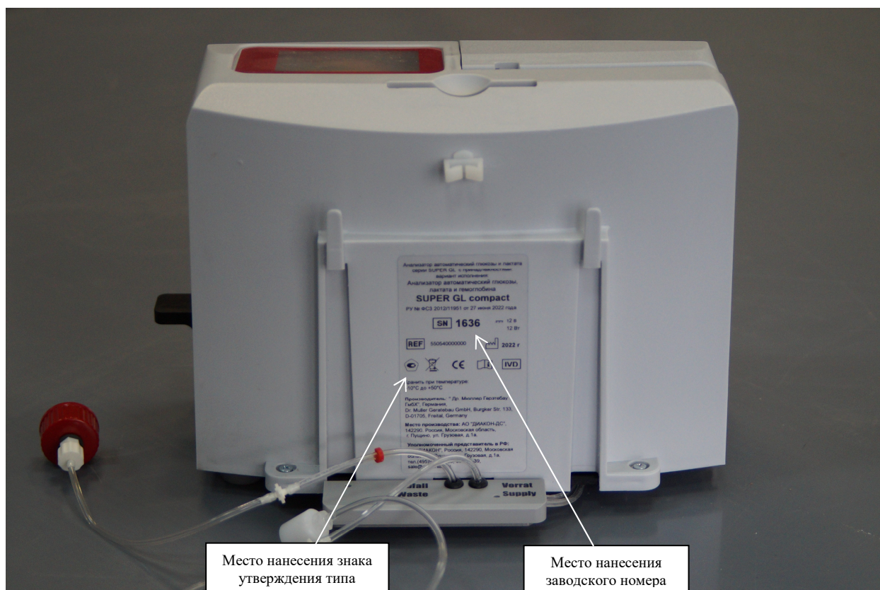
Рисунок 4 – Схема нанесения маркировки на анализатор вариант исполнения SUPER GL compact