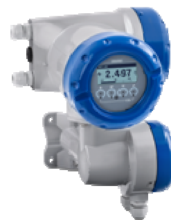
б) MFC 400F