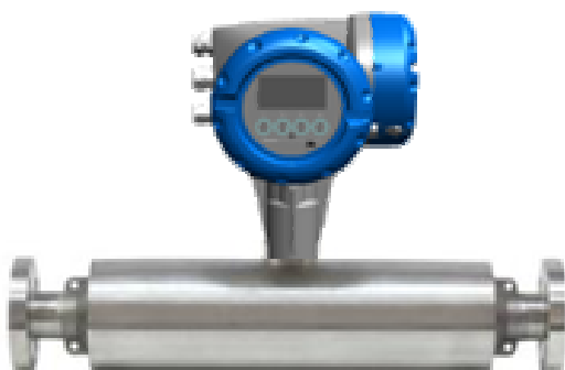
в) OPTIMASS 1400C