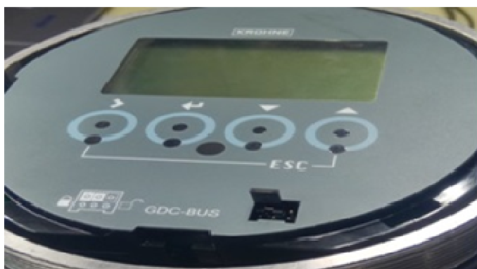
Рисунок 2.1 – Установка перемычки.