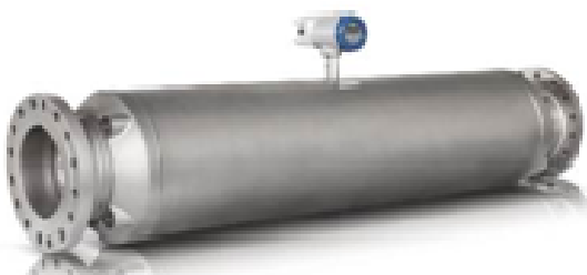
д) OPTIMASS 2400C