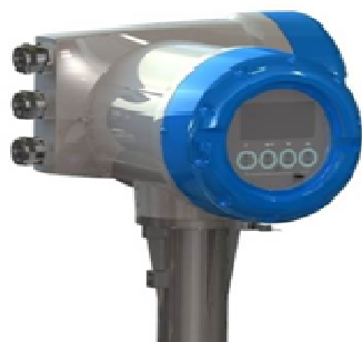
а) MFC 400C