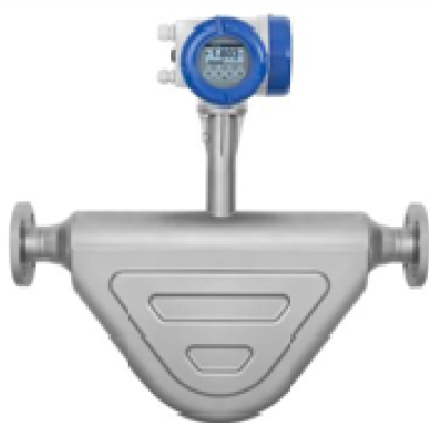
ж) OPTIMASS 6400C