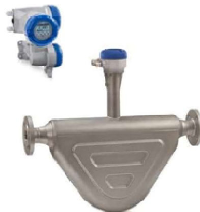
и) OPTIMASS 6400F