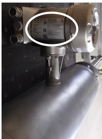
Рисунок 3 – Место нанесения маркировочной таблички