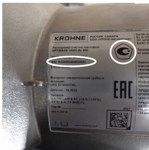
Рисунок 4 – Место нанесения знака утверждения типа и заводского номера