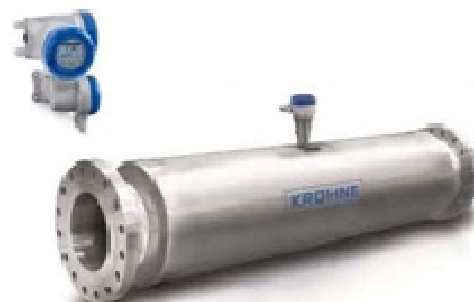
е) OPTIMASS 2400F