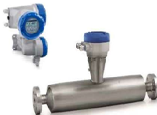
г) OPTIMASS 1400F