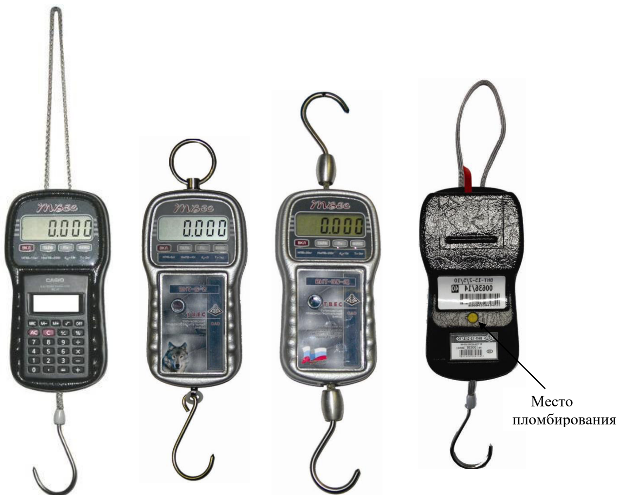
Рисунок 2. Внешний вид весов без литеры «М»