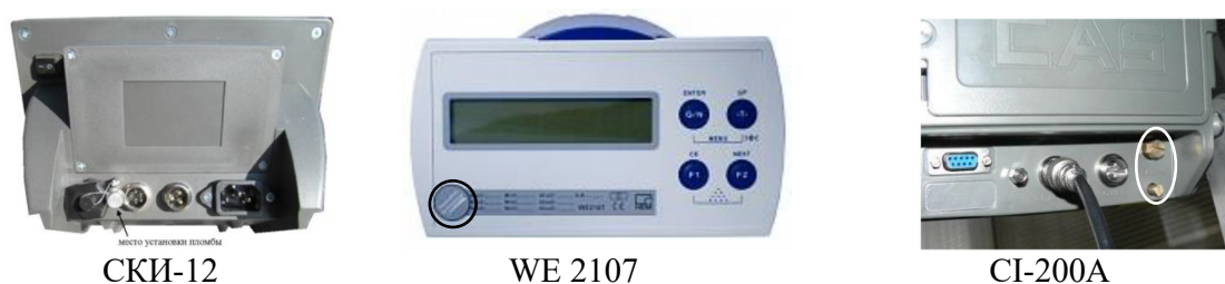
Рисунок 4 - Места пломбировки приборов (индикаторов) весоизмерительных