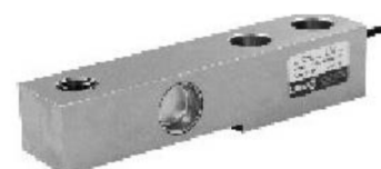
Bend Beam (B6E, H6E)