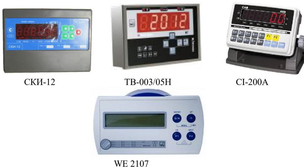
Рисунок 3 - Общий вид приборов(индикаторов) весоизмерительных