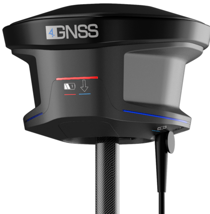
Рисунок 1 – Общий вид аппаратуры геодезической спутниковой

Общий вид аппаратуры представлен на рисунке 1.