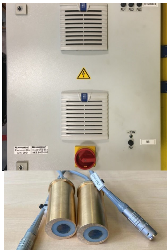
Рисунок 1 – Общий вид систем