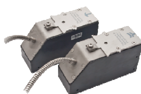
ПИР RG(F) 721