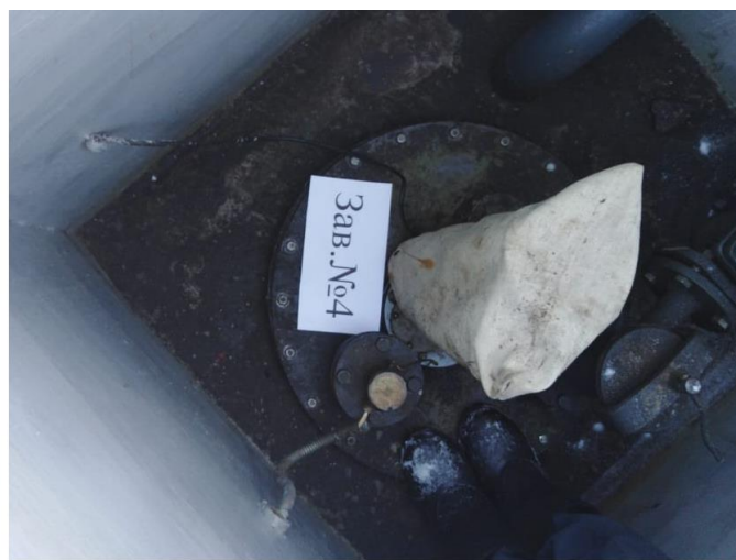
Рисунок 1 – Общий вид резервуаров РГС-50