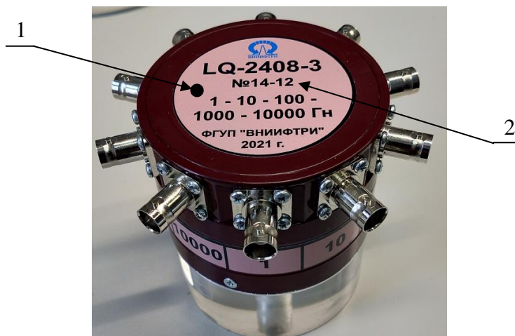
Рисунок 2 – Общий вид меры LQ-2408-3:

Общий вид меры LQ-2408-3 представлен на рисунке 2.