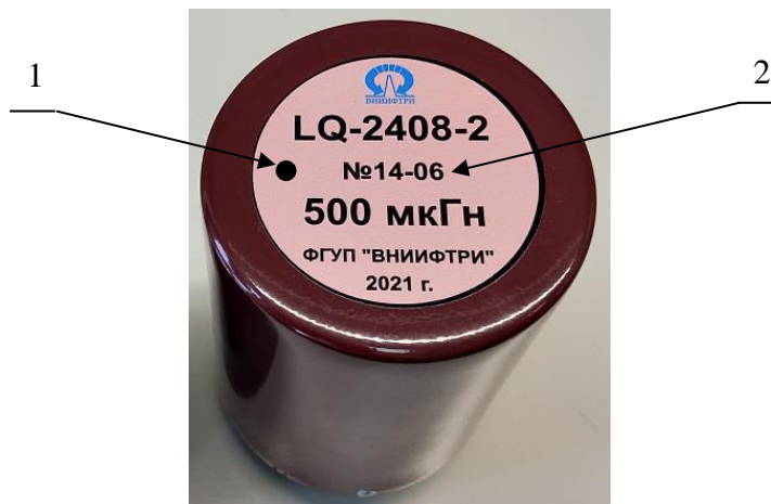
Рисунок 1 – Общий вид меры LQ-2408-2:

Общий вид меры LQ-2408-2 представлен на рисунке 1.