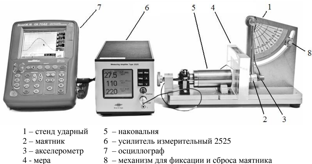
Рисунок 6.1 – Установка для поверки мер

m_n – масса индентора закрепленного на маятнике, кг.